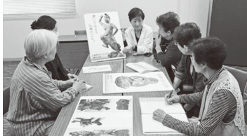
上/常設展示室での解説の様子 下/解説後の反省会