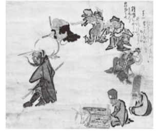
白隠慧鶴《七福神図》 江戸時代(18世紀) 佐野美術館蔵