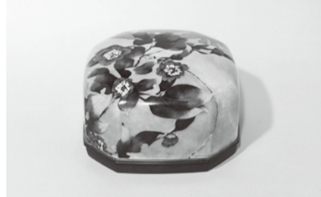
九鬼英子 有線七宝筥《冬日和》 平成12年(2000) 佐野美術館蔵