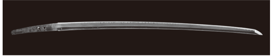
刀 銘 和泉守藤原兼定 石破渋谷木工頭明秀/伊勢山田是作 永正十三年 金象嵌銘 二胴切落 室町時代(1517) 佐野美術館蔵

南北朝時代から室町時代にかけて、 刀剣の生産地として発展した美濃(岐阜県)ゆかりの刀をご紹介します。