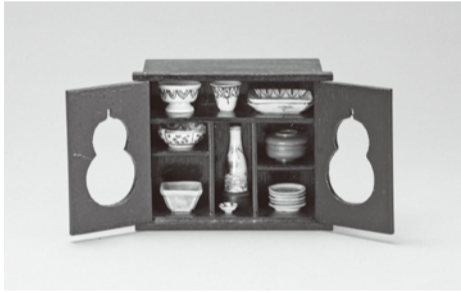
御酒道具 武蔵屋製 江戸時代後期～明治時代中期 川内由美子コレクション

江戸の「ぜいたく屋」展に出品している川内由美子氏によるギャラリートークです。七澤屋と武蔵屋の極小雛飾りの見どころなど盛りだくさん!