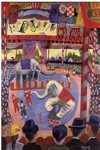
鈴木信太郎「象と見物人」1930(昭和5)年 財団法人そごう美術館蔵 「親密な空間、色彩の旅人 鈴木信太郎」展 平成19年4月14日(土)~5月28日(月)