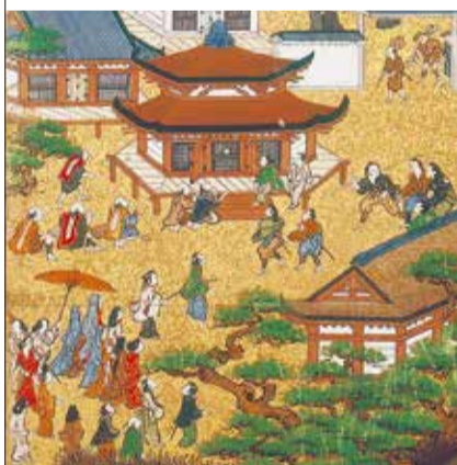
《和歌浦天橋立図屏風》江戸時代(18世紀頃)(左隻)部分/全図 佐野美術館蔵