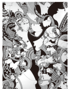
《時の流れ》 素材：紙、ペン

さんしんギャラリー 善【展覧会開催時のみオープン】 11:00～16:30 木曜休館 〒411-0857 静岡県三島市芝本町12-3 TEL 055-991-0034 https://www.sanshin-zen.jp/