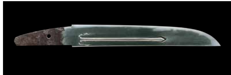
国宝 短刀 無銘 正宗(名物庖丁正宗)鎌倉時代 徳川美術館蔵