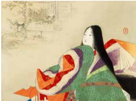
水野年方《三宅青軒著「寂光院」『文芸倶楽部』第7巻第13号 口絵 明治34年(1901)博文館刊 朝日コレクション