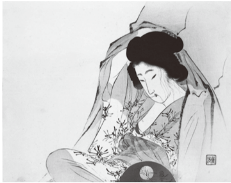
富岡永洗《小杉天外著『蛇いちご』口絵》 明治32年(1899) 春陽堂刊 朝日コレクション

日時：7/18(土) 11:00～12:00/14:00～15:00 講師：朝日智雄(立命館大学アート・リサーチセンター客員研究員) 河内えり子(佐野美術館副館長・学芸グループ長) 会場：佐野美術館講堂 定員：各回20名 参加費：1,000円 ※要申込・先着順