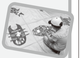
2024年度イベントより▲ 「命かがやくワークショップ」