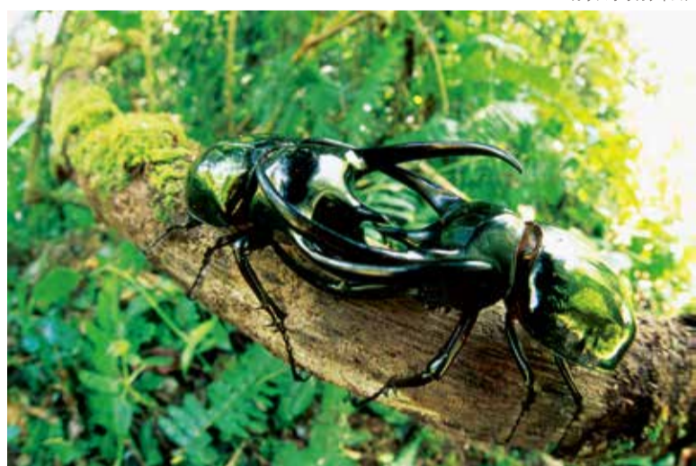
コーカサスオオカブトムシ