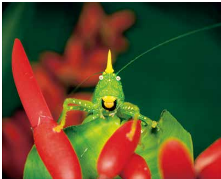
キイロツノギスの顔

農地を耕し、農薬を使わず作物を育てることで、カエルやトンボなどの生き物たちが戻ってきているそうです。