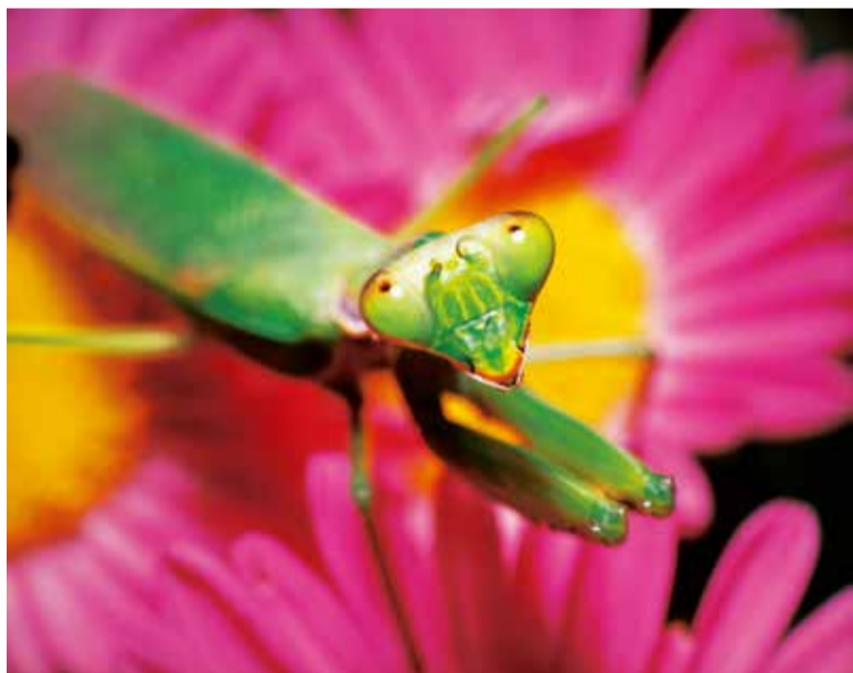
ハラビロカマキリ