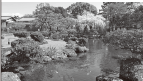
2024年度 SNS 掲載の写真より

佐野美術館では、Facebook、Instagram、X に よる情報発信をおこなっています。