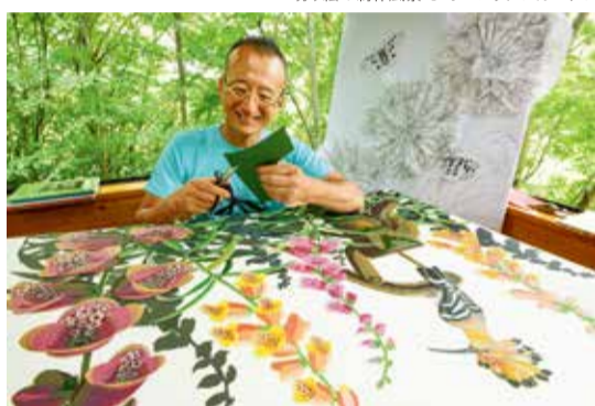
切り絵の制作風景

マレーシアに生息するコーカサスオオカブトムシのオス2匹が角を突き合わせて戦っています。艶々と光沢のあるボディに、夏の強い光りで周囲の緑が写り込んでいます。(写真右下)